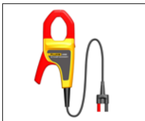
电流钳 I400E: 配合全新福禄克掌上系列万用表, 包括 Fluke101, Fluke106, Fluke107 使用, 能够扩展这些万 用表的电流测试能力, 同时, 该电 流钳, 也适用于所有具有毫伏交流 测试功能的测量仪器。