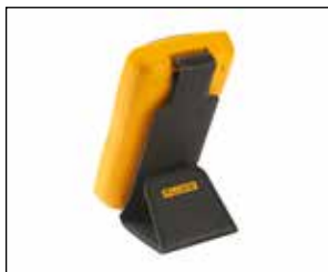
智能磁性挂件 Smart Strap: 适用于 101/106/107;